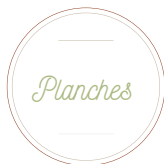
PLANCHE DE CHARCUTERIES (5 CHARCUTERIES)

M (2 PERS.) 15,00€ / L (4 PERS.) 30,00€ / XL (6 PERS.) 45,00€